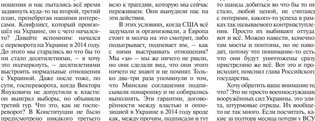
Сейчас, по моему, 244 тысячи находятся на-