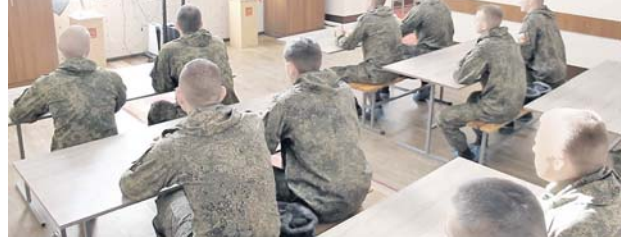
Сейчас, по моему, 244 тысячи находятся на-

В этих условиях, когда США всё задумали и организовали, а Европа стоит и молвит на это смотрит, либо подпрыгивает, подпевает им, — как с ними выстраивать отношения? Мы «за» — мы же ничего не рвали, но они сделали вид, что они этого ничего не знают и не помнят. Только два-три раза упомянули о том, что Минские соглашения подписывали понарошку и не собирались выполнять. Эти гарантии, договорённости между властью и оппозицией в Украине в 2014 году вроде как, между прочим, подписали и тут