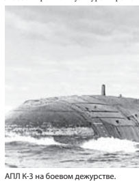
АПЛ К-3 на боевом дежурстве.

— Странный проект атомной со всей ответственностью. Я как старшина знал: если дал задание, то оно должно быть выполнено. При любых обстоятельствах, в любое время. Культура произ-