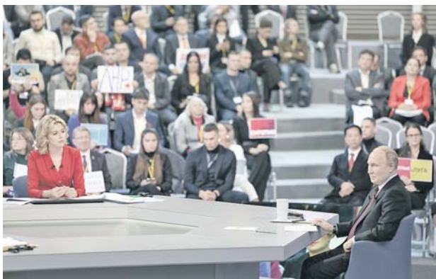
Некоторые лица в Киеве упоминали, в целом они не соглашались с тем, что нужна какая-то денацификация, и говорили о том, что никакой фашизации, роста таких настроений нет. Как же нет? Когда национальный герой — известный не просто националист, а наместник Бандеры возведён в ранг национального героя. Как же нет?

Глава государства пояснил эти тезисы. «Смотрите, что происходит с точки зрения денацификации. В ходе переговорного процесса, который имел определённый этап после подготовки проекта возможного соглашения, о чём недавно офици-